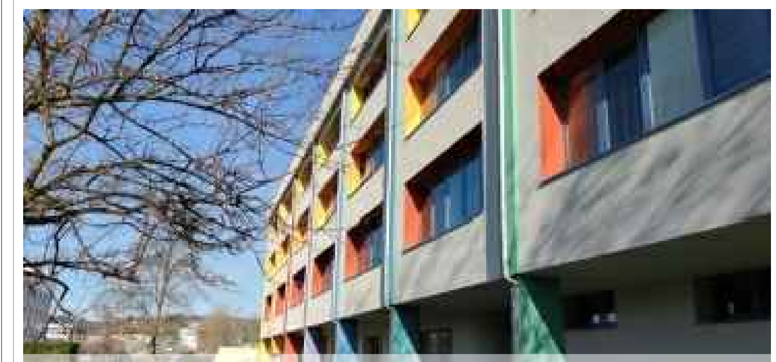
Interventi urgenti alla copertura e alle fosse biologiche della scuola secondaria di primo grado di Sovigliana, Vinci