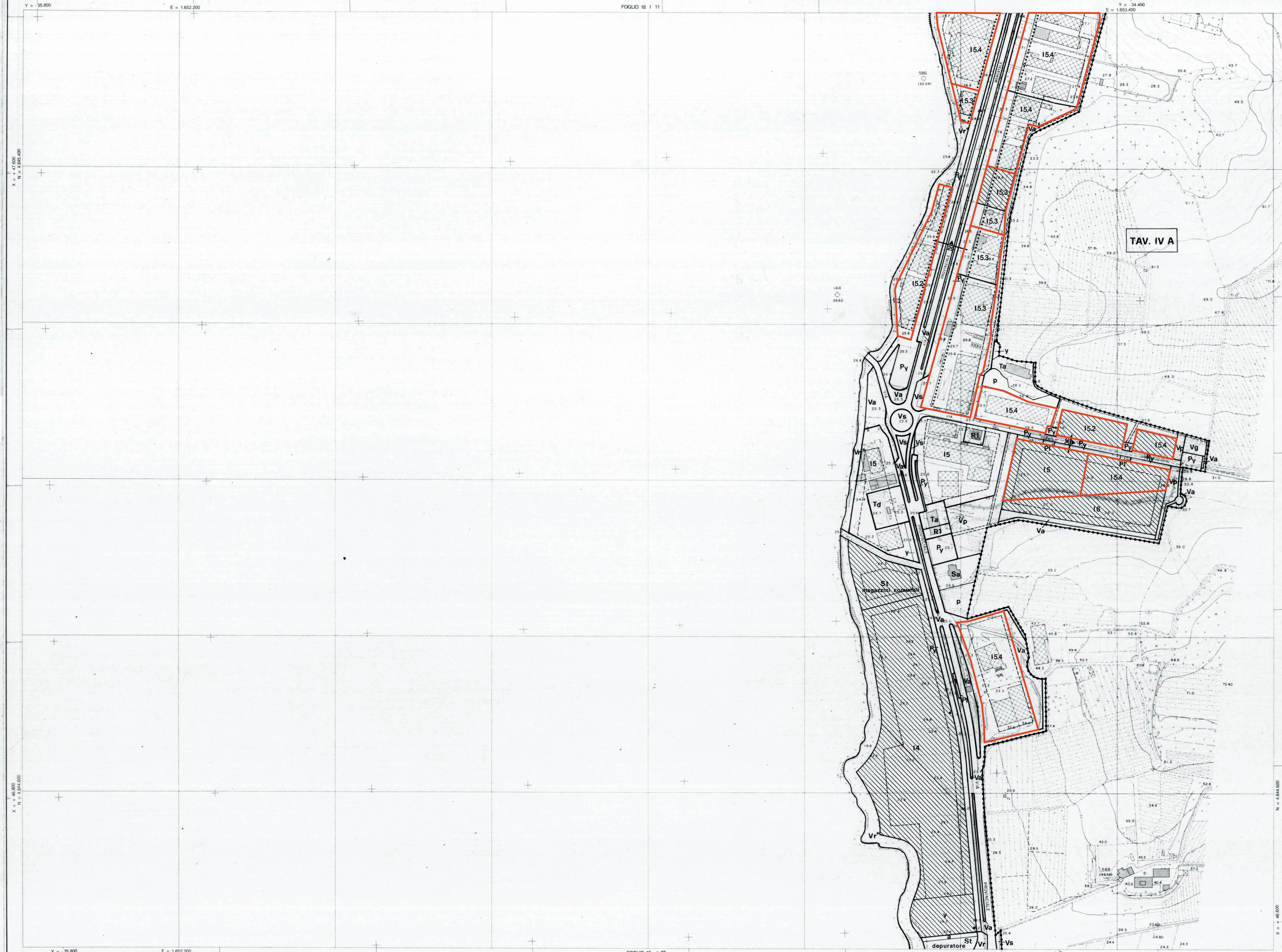
TAV. IV A

Y = 35.800 E = 1.652.200 X = 47.600 N = 4.685.000