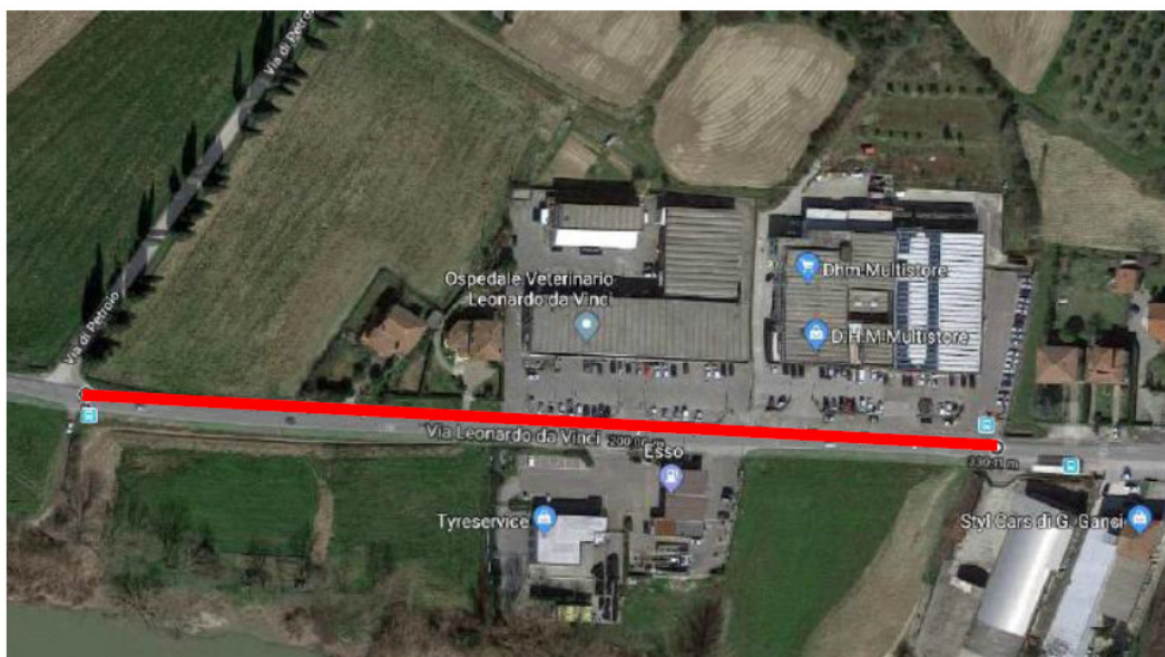
Figura 2 – Tratto lotto 2

La larghezza della fascia disponibile è sufficiente ad ospitare la sezione del percorso, ancorché maggiorato ad una larghezza di 3,00 m piuttosto che di 2,50 m come per i percorsi ciclabili bidirezionali e riservando al solo pedone la fascia tra il muretto e la pista ciclabile di larghezza variabile tra 1.50-1.80m.