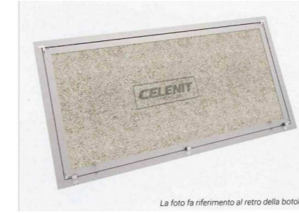
DETTAGLIO BOTOLA TIPO CELENIT