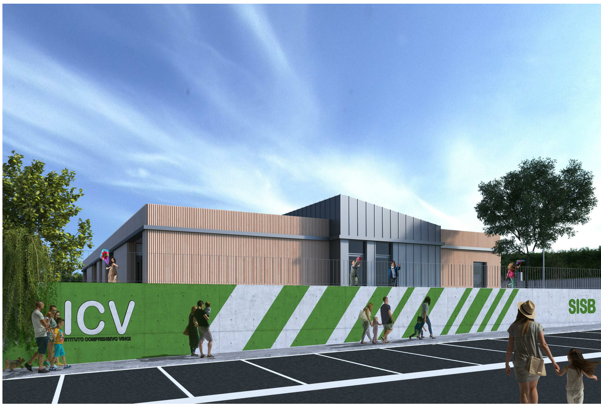
GM-Render Esterno da strada 1 : 500