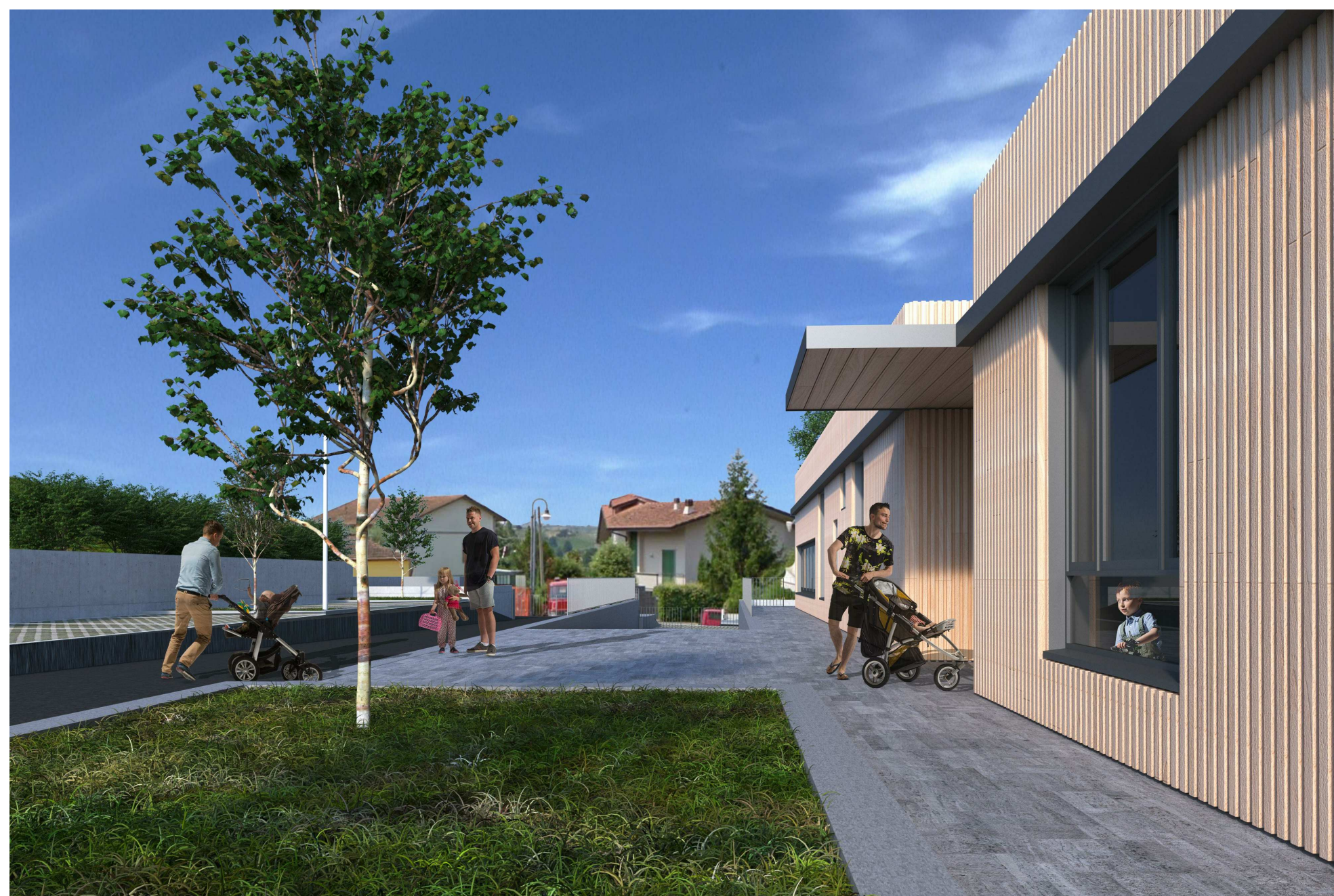
GM-Render Esterno ingresso principale 1 : 500