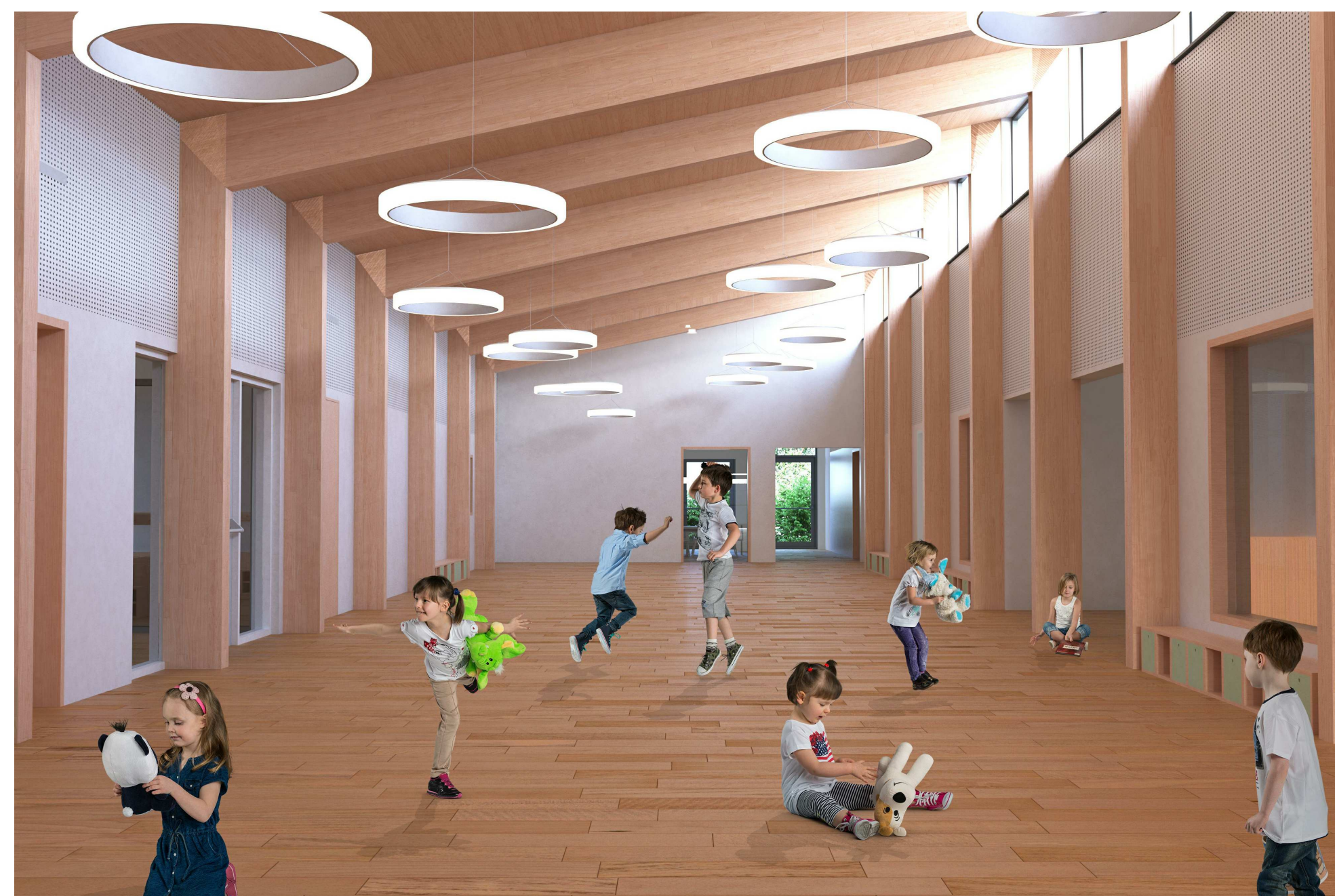
GM-Render Interno dell'atrio 1 : 500